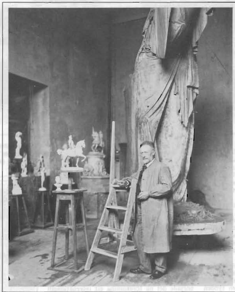
Ett av ANTON BLOMBERGS porträtt i miljö: skulptören J Börjesson, från ett IDUN-reportage.

Men bildpress hade det ju funnits länge. Redan på 1840-talet startades de första, stora bildtidningarna Illustrated London News , L'Illustration (i Paris) och Illustrirte Zeitung (i Leipzig). Sverige fick också sin Illustrerad Tidning , följt av Ny Illustrerad Tidning (1855 respektive 1865).